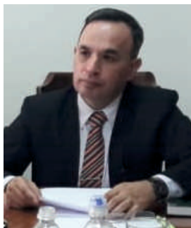
Abg. Luis Cardozo Olmedo Ministro Auditor General del Poder Ejecutivo